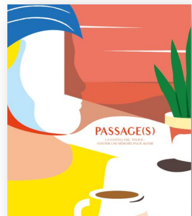
Passage(s), le livre mémoire sur les habitants de la Tour K de La Castellane