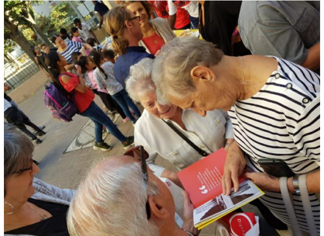
Vernissage de l'exposition Passage(s) en septembre 2018 au centre social de La Castellane en présence des habitants.

Pour les habitants de la tour K, voir disparaître leur espace de vie peut représenter une forme de dévalorisation de leur histoire personnelle, quand bien même leurs conditions de vie se sont aujourd'hui améliorées. C'est pourquoi Erilia a engagé tout au long du processus de relogement une démarche mémorielle pour garder une trace des vies passées et donner à voir ce moment de transition dont le témoignage se lit dans le recueil tiré de l'exposition « Passage(s) » réalisée par le photographe Teddy Seguin pour le compte d'Erilia. Au fil d'une série de portraits, l'objectif du photographe capte l'attachement des anciens résidents de la tour K à leur quartier. Un regard où la nostalgie affleure. Tout comme l'enthousiasme du passage vers une nouvelle vie, dans un nouvel environnement.