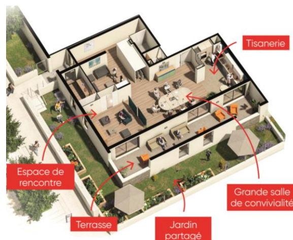
Vue 3D des espaces communs de la résidence Les Voiles