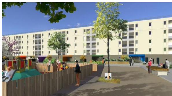
Réhabilitation et résidentialisation « Le Petit Archimède » - Label BBC Rénovation et Bâtiment Durable Occitanie niveau Argent